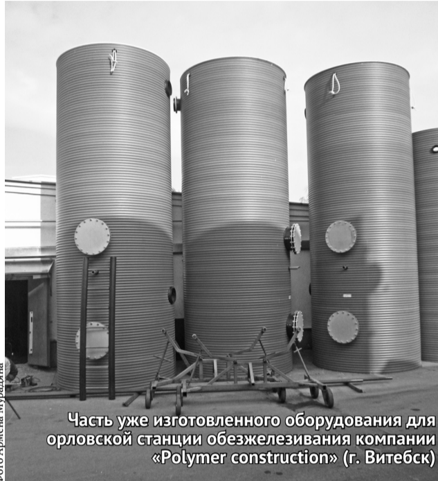
Часть уже изготовленного оборудования для орловской станции обезжелезирования компании «Polymer construction» (г. Витебск)