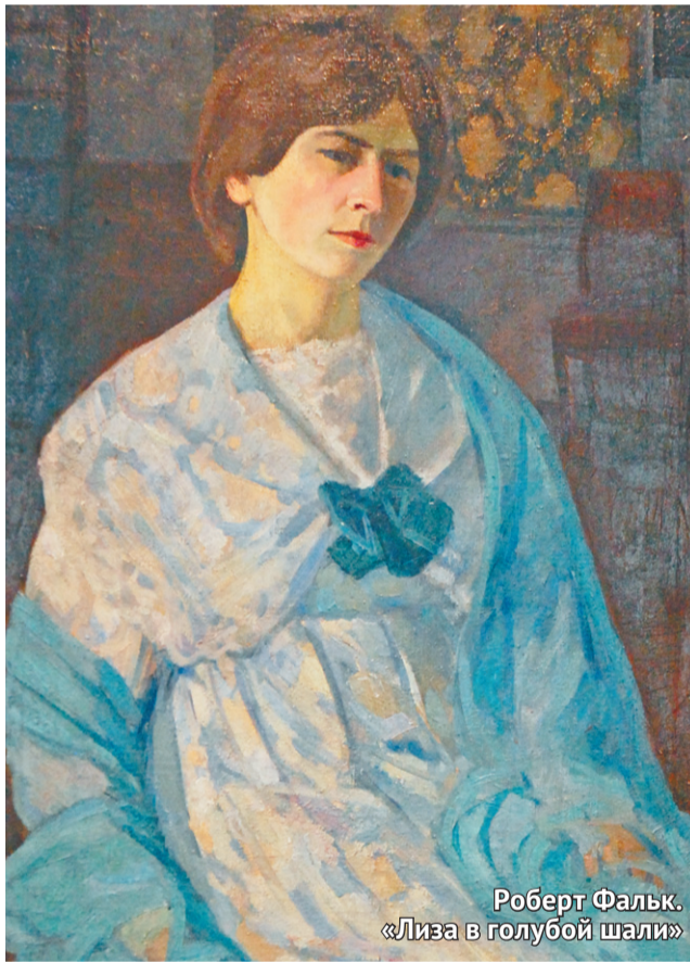
Роберт Фальк. «Лиза в голубой шали»

ла сознание художественного мира раз и навсегда, дав почву постмодернизму и современному искусству.