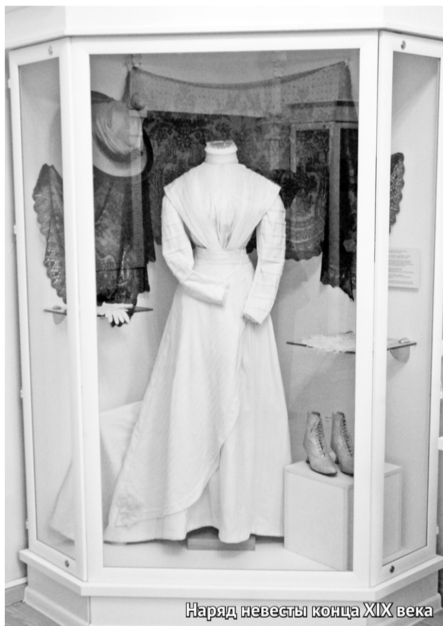
Наряд невесты конца XIX века