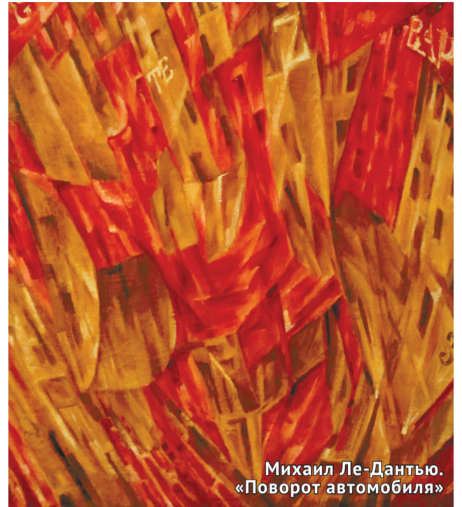
Михаил Ле-Дантью. «Поворот автомобиля»

«Сотрудникам орловского музея удалось собрать поистине редчайшие произведения русского авангарда, принадлежащие кисти самых известных русских художников.»