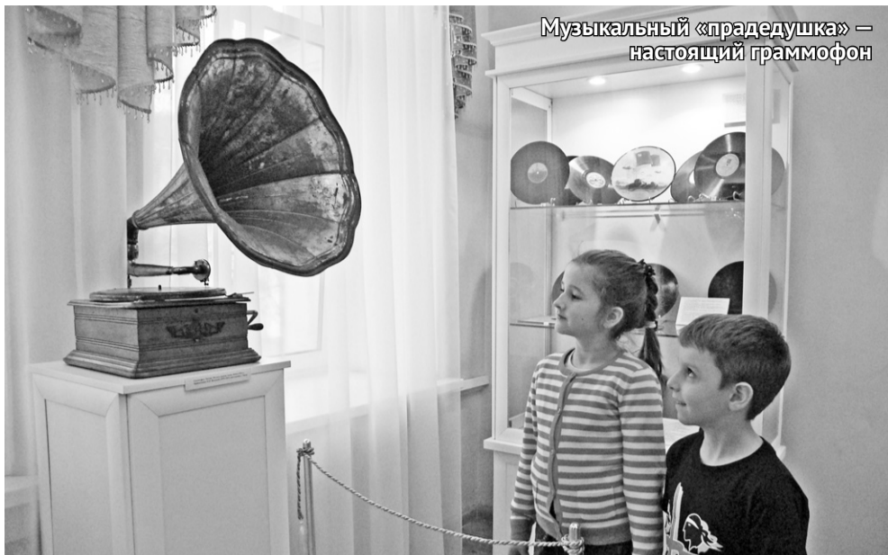
Музыкальный «прадедушка» — настоящий граммофон

На днях в Орловском краеведческом музее открылся очередной зал постоянной исторической экспозиции — «Коллекционный».