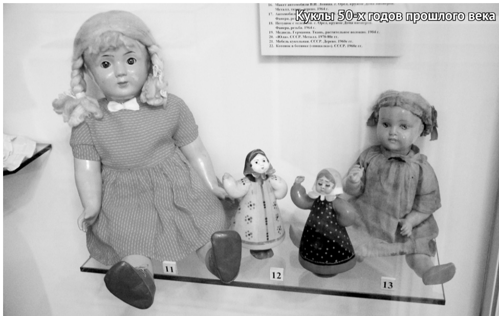
Куклы 50-х годов прошлого века