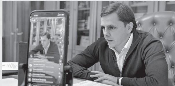
Главное из прямого эфира в социальных сетях губернатора Орловской области Андрея Клычкова за минувшую неделю.