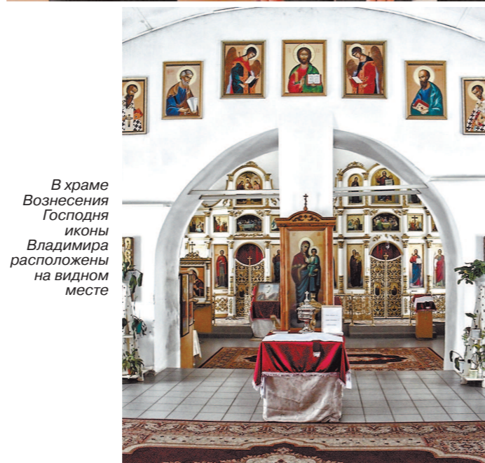
В храме Вознесения Господня иконы Владимира расположены на видном месте