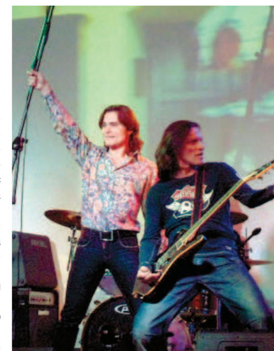
На концерте в Орле «Земляне» споют самые популярные и зажигательные хиты

У читателей «Орловской правды» есть возможность выиграть два билета на концерт группы «Земляне». Для