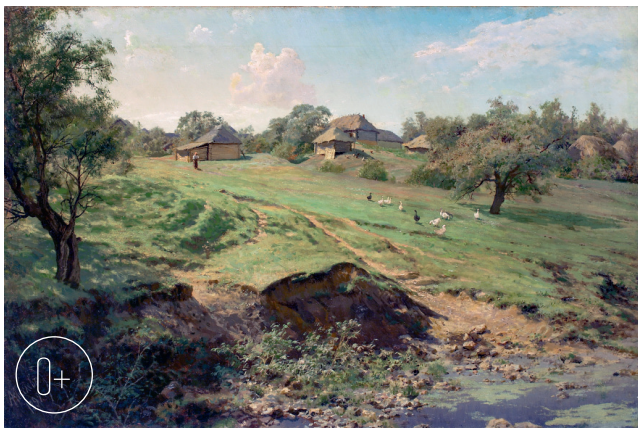
Александр Киселёв (1838—1911). «Хутор». 1899 г.