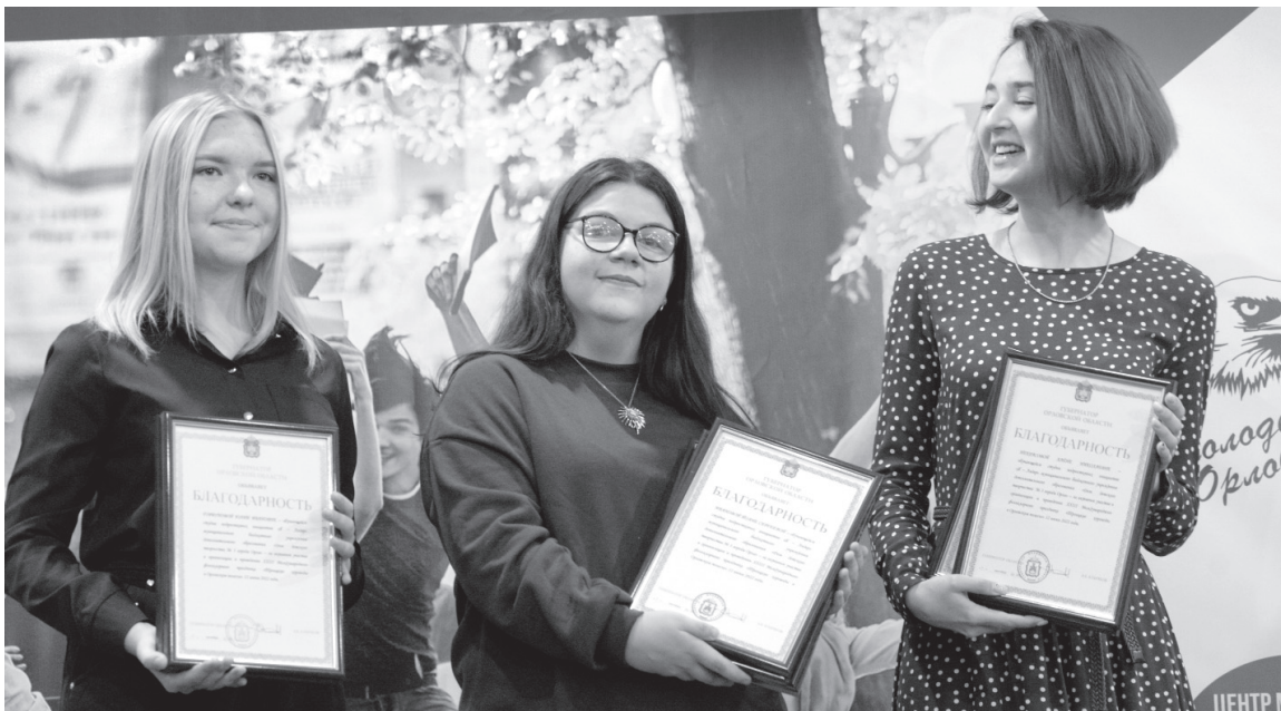
Благодарности губернатора Орловской области — самым активным и креативным волонтерам