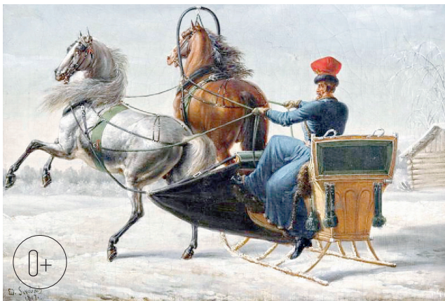
Бернард-Эдуард Свебах (1800—1870). «Выезд на паре». 1817 г.