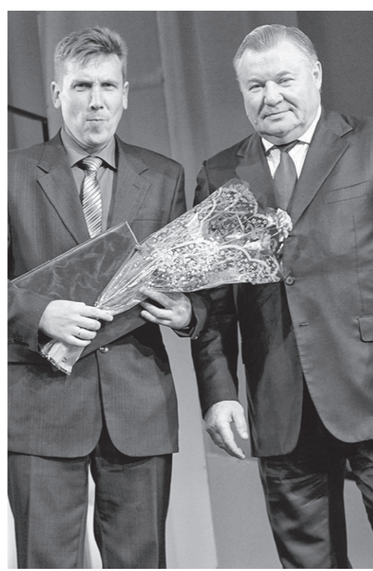
Губернатор поздравил лучших людей Орловщины

Завершилось торжество праздничным концертом.