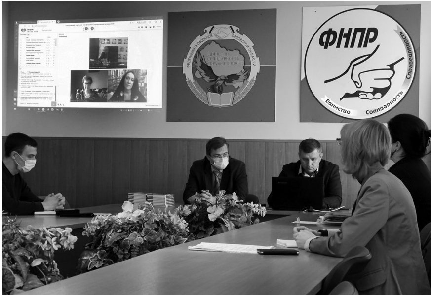
Активная молодёжь — боевой профсоюз