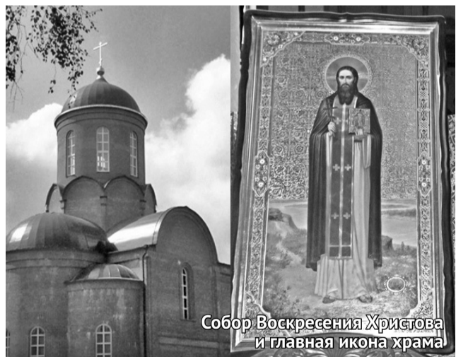
Собор Воскресения Христова и главная икона храма

бята из Тельчья сами обратились с инициативой в районную администрацию. Дети попросили оборудовать в селе тренажерный зал для занятий. Ребята не только поддержали, но даже разрешили самим составить список понра-