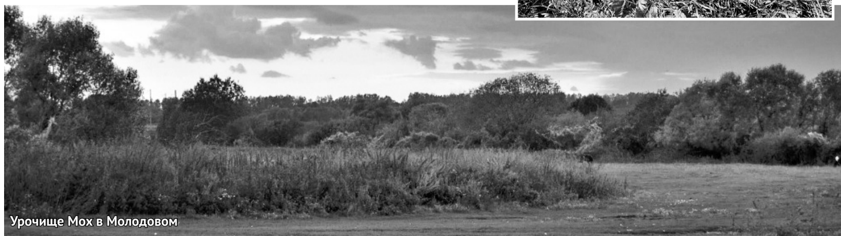
Урочище Мох в Молодовом