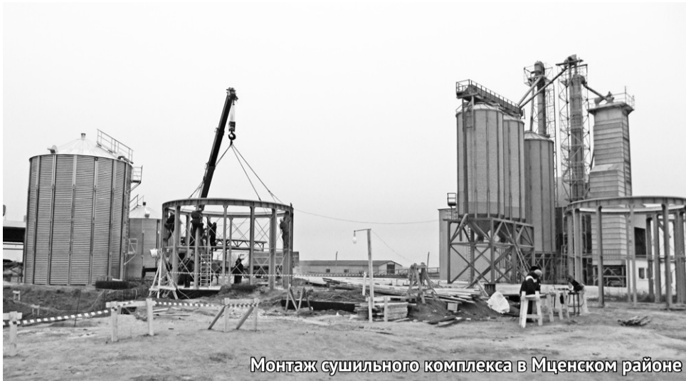
Монтаж сушильного комплекса в Мценском районе

Во время посещения предприятия мы застали процесс монтажа нового сушильного комплекса. Один подобный комплекс уже имеется на предприятии. Теперь компания может заниматься обработкой одновременно нескольких культур. Завершение работ планируется в мае 2015 года. Монтируют сушильный комплекс мценские специалисты. А само оборудование было приобре-