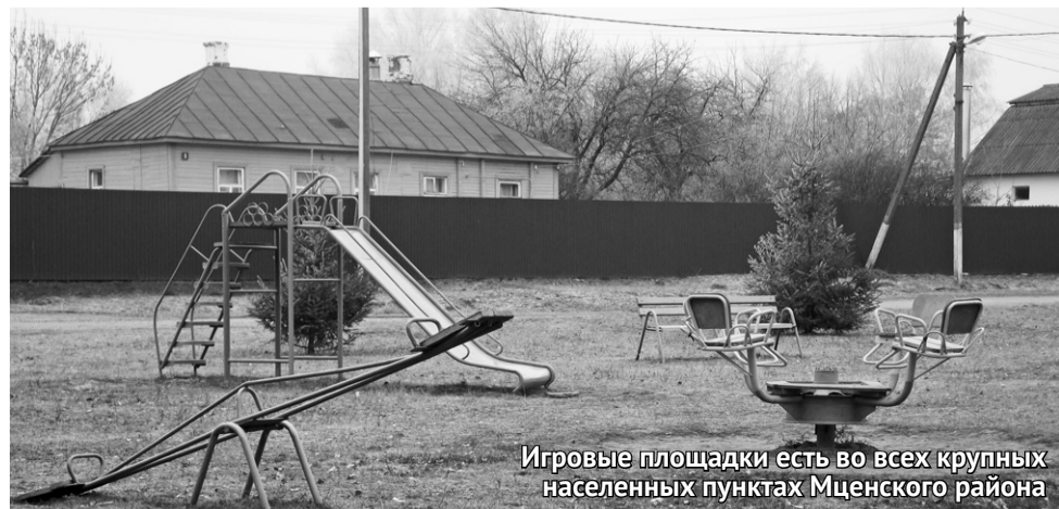
Игровые площадки есть во всех крупных населенных пунктах Мценского района

чего чая, чтобы хоть как-то согреть прихожан. В этом году послушники монастыря постараются организовать дополнительные пункты выдачи воды из источника. А греться все желающие смогут в отапливаемом храме.