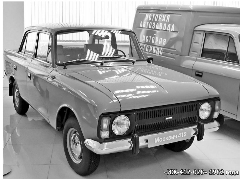
«ИЖ-412-028» 1982 года

К середине 60-х годов уровень жизни советских граждан повысился настолько, что люди начали делать денежные накопления. Причем вопреки призывам хранить деньги