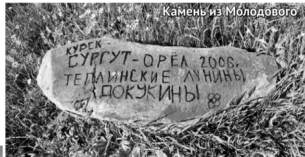
Камень из Молодового