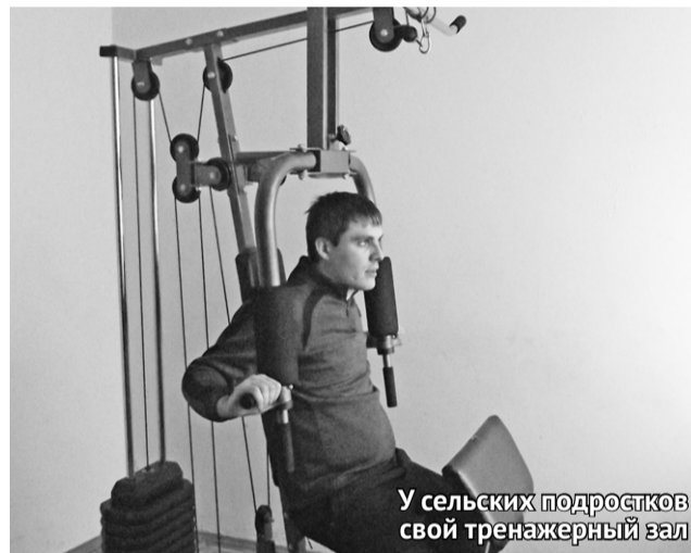
У сельских подростков свой тренажерный зал

В апреле планируется освящение собора. Это будет большой праздник, которого с нетерпением ждут монахи.