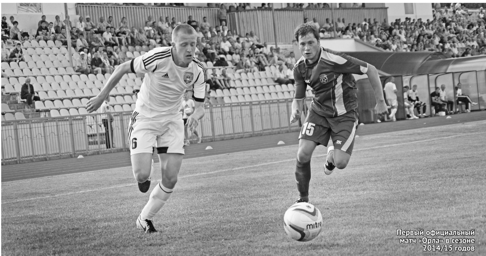
Первый официальный матч «Орла» в сезоне 2014/15 годов