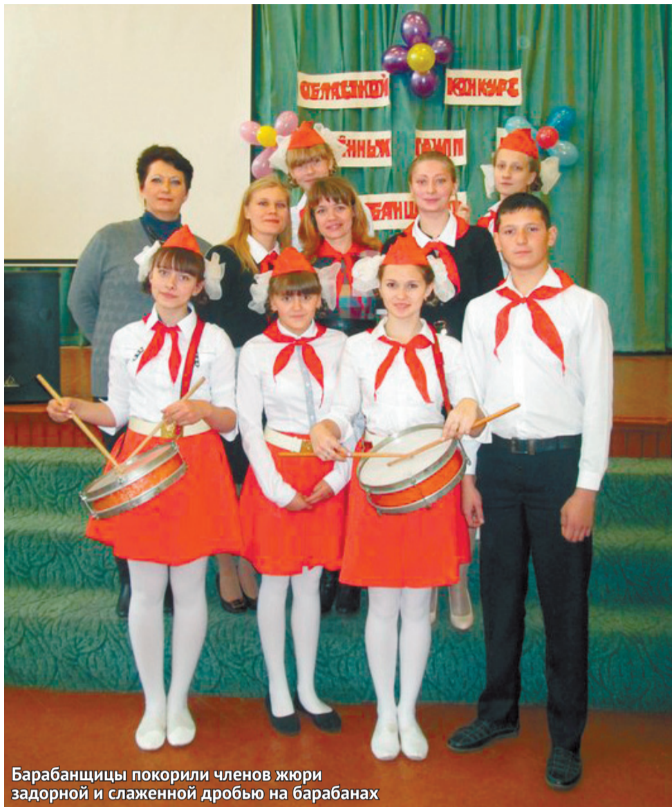
Барабанщицы покорили членов жюри задорной и слаженной дробью на барабанах

В Орле завершился областной конкурс знаменных групп и барабанщиков.