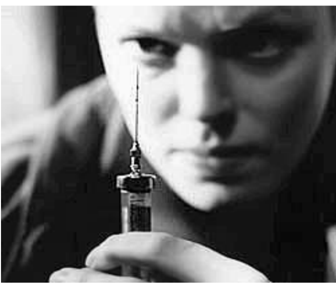
Управление Федеральной службы Российской Федерации по контролю за оборотом наркотиков по Орловской области рекомендовано проводить ежеквартальные координационные совещания с соответствующими службами иных федеральных органов и органов государственной власти Орловской области в целях эффективного противодействия распространению наркотических средств и психотропных веществ на территории области; осуществлять на постоянной основе мониторинг масштабов распространения наркомании; разрабатывать предложения о внесении изменений в законодательство Орловской области в части установления ответственности руководителей и иных должностных лиц организаций, специализирующихся на предоставлении различного рода услуг досуга, за попустительство распространения наркотических средств и психотропных веществ на подведомственных территориях (в помещениях).

Управлению здравоохранения поручено рассмотреть вопросы укрепления материально-технической базы наркологической службы, ужесточения ведомственного контроля за деятельностью учреждений здравоохранения и аптек по назначению и отпуску наркосодержащих лекарственных препаратов. Управлению общего и профессионального образования дано указание принять меры по сохранению сети образовательных учреждений дополнительного образования, обеспечению условий для внеурочной работы с детьми и подростками. Управлению по делам мо-