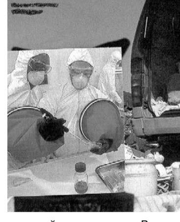
милицейская машина. Взяли служивые банку да заодно и Смуглого с мечеными семью тысячами. Дело техники.

— Какой впервые? А кто меня ещё в октябре, когда мы познакомились, бесплатной дозой угостил? Кто покупателей попросил? У кого я раза четыре сам куповал, за что, прости меня аллах, и погорел? Пуагут друг друга, сваливают вину один на друго-