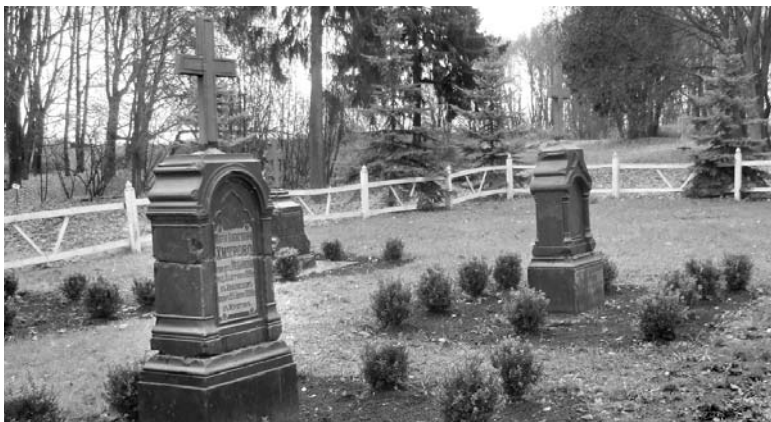
Фамильное кладбище рода Хитрово в Муратово.

Старинных строений в усадьбе не сохранилось, зато особое очарование заповедному месту придают деревья-долгожители. Здесь можно увидеть такие виды, как кедр сибирский, пихта европейская, туя западная, ель голубая, лиственница сибирская. Символом рода Хитрово я бы назвала могучий красавец дуб, посаженный в середине позапрошлого столетия. Когда-то только сирени в усадьбе насчитывалось более трех десятков видов. Украшением родового парка являются липовые аллеи.