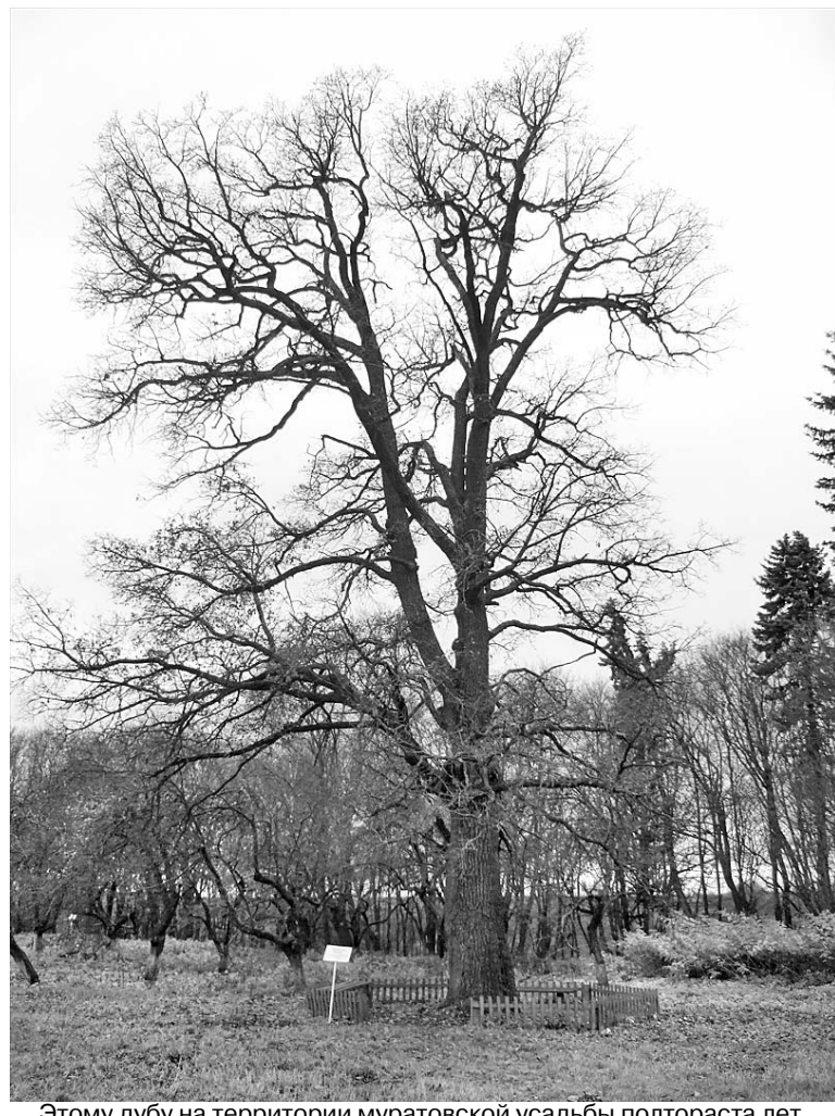
Этому дубу на территории муратовской усадьбы полтора века лет.