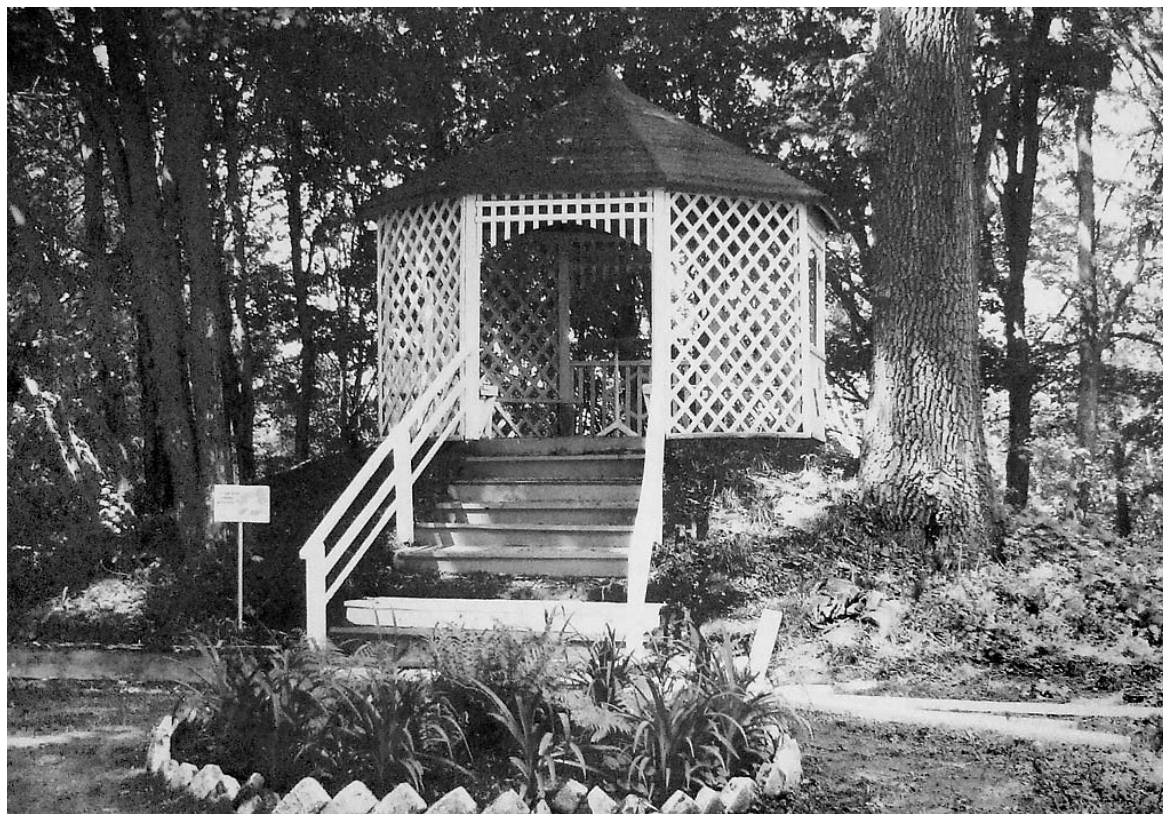
Беседка на месте метеостанции.

Эльвира ЛЕГОСТАЕВА.