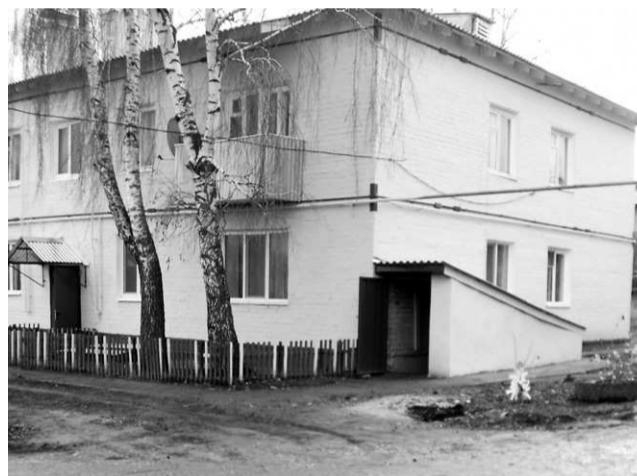
п. Залегощь, ул. Гагарина, д. 80

нами государственной власти и местного самоуправления мер в сфере ЖКХ размещается на сайте администрации Залегощенского района. Утверждены порядок и график проведения регулярных встреч представителей органов местного самоуправления с гражданами по различным вопросам ЖКХ, а также график проведения информационных курсов, семинаров по тематике ЖКХ для представителей ТСЖ, многоквартирных домов,