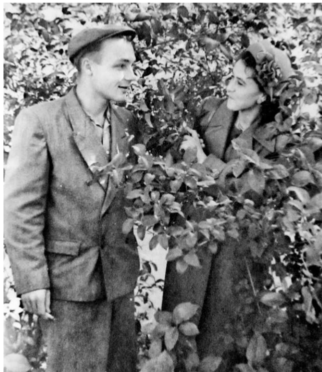
Молодые супруги через год после свадьбы

Супруг делает суровое лицо, но взгляд лучится нежностью. Они