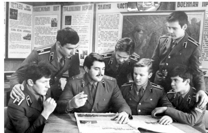
Нам, ровесникам XX съезда партии, на котором в 1956 году был разоблачен культ личности Сталина, довелось пройти весь путь в комсомоле, от 14 до 28 лет. Это самые незабываемые годы.

Словом, комсомол — это не просто мощная молодежная организация советского времени, комсомол — это часть нашей жизни, часть нашей судьбы, часть нашей истории. Комсомол — это эпоха.