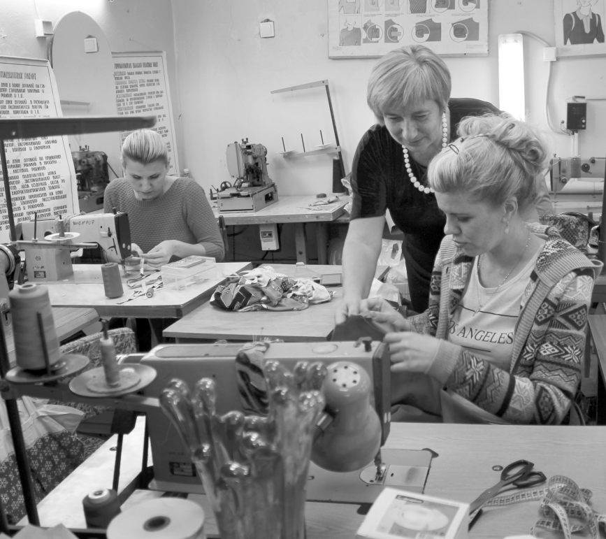
В учебном центре службы занятости безработные постигают секреты швейного дела

Почти 1,5 тысячи орловцев прошли бесплатное профессиональное обучение.