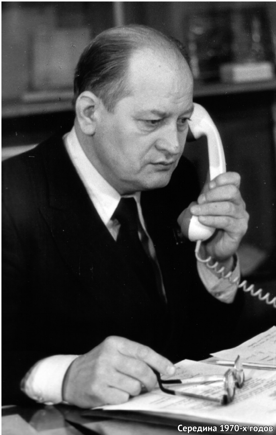
Середина 1970-х годов