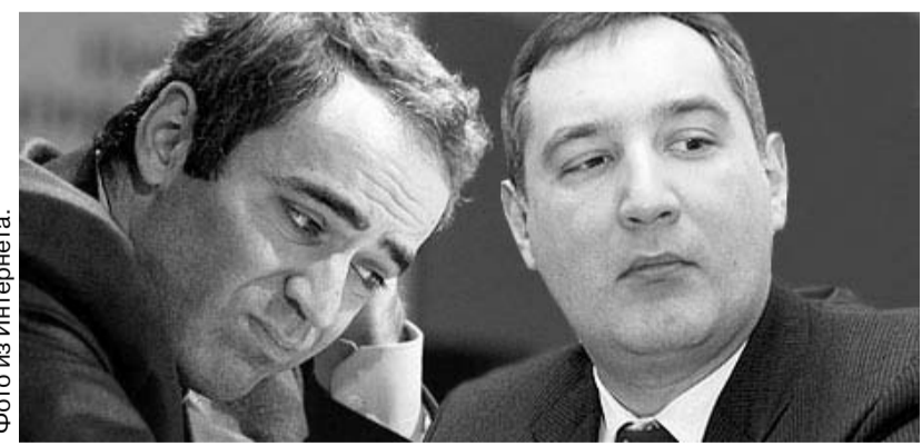
Члены Общественной палаты РФ потребовали в минувшее воскресенье провести расследование обстоятельств смьчки некоторых российских политиков с неофашистскими организациями. Среди замеченных в связях с нацистами — Дмитрий Рогозин и Гарри Каспаров.

Они обеспокоены разжиганием межэтнической вражды, деятельностью