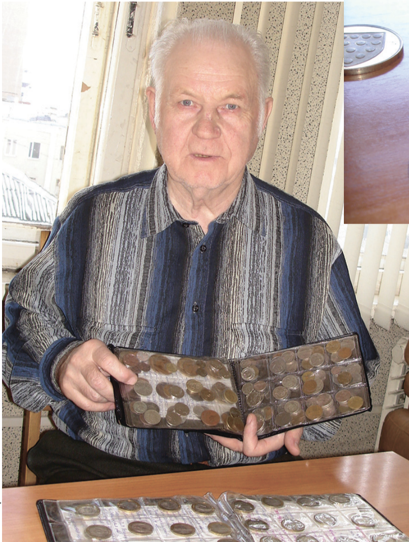
Алексей Кривоногов: — Монеты, о каждом короле расскажут его диковинную историю