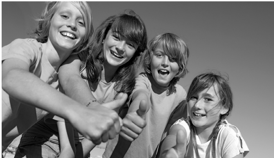
Школьники ждут не дождутся летних каникул

В связи с недостаточным финансированием количе-