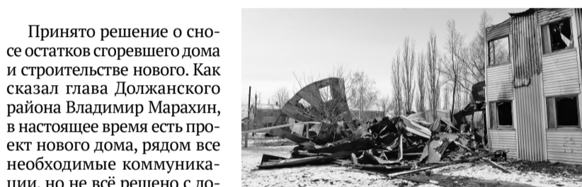
Всё, что осталось от 16-квартирного дома