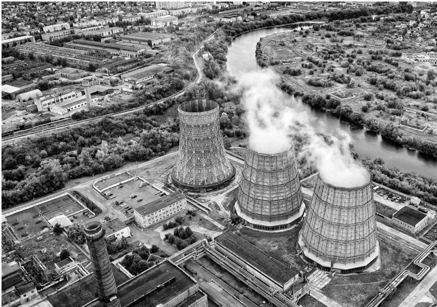
Накануне отопительного сезона вызывают тревогу многомиллионные долги перед поставщиками газа, тепла, электроэнергии

Депутаты облсовета обсудили готовность региона к предстоящему отопительному периоду.