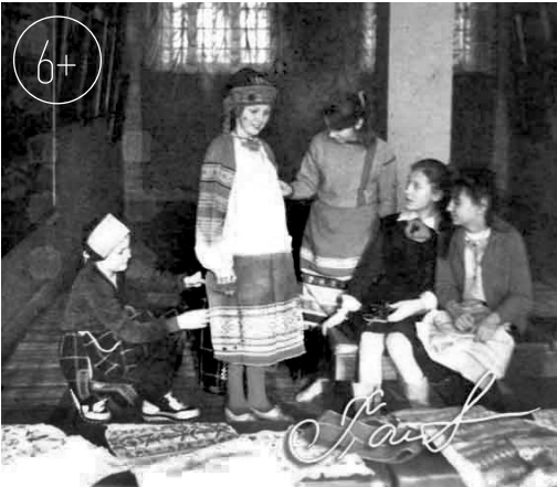
Орловский список. Подготовка к выставке