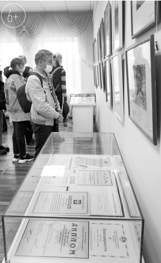
В экспозиции много документов — дипломов, почётных грамот, благодарностей

мевший привить дочери любовь к искусству, фотографии и в том числе. Простенькая «Смена», подаренная им, по-