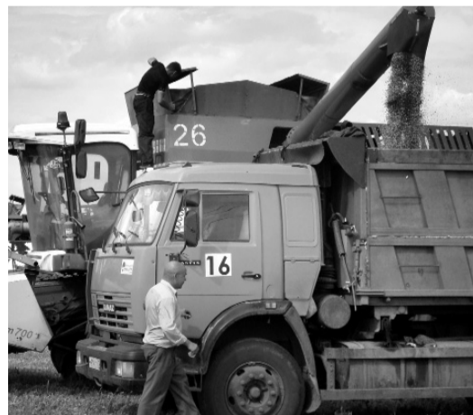
Сейчас дорога каждая минута