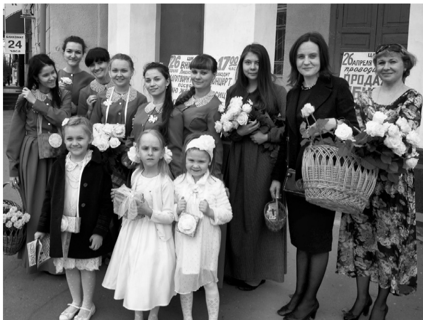
Благотворительный праздник «Белый цветок»