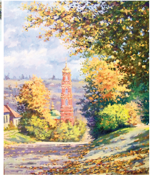
«Болхов. Осень. Георгиевская церковь»