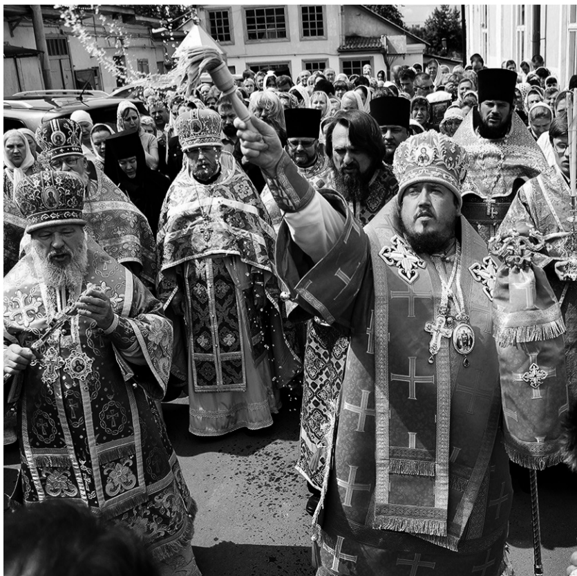
Праздник Ахтырской иконы Божией Матери в Орле. 15 июля 2015 года

Подвижки есть. В Красноренском районе идут переговоры о строительстве церкви в райцентре. Отрадно, что местная власть понимает: храм нужен, коренные духовные ценности необходимо передавать детям. Бездуховность порождает пороки, которые, к сожалению, распространились в нашем обществе.