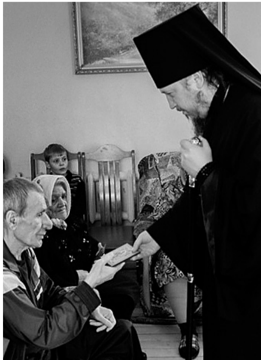
Владыка в доме ветеранов