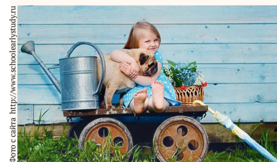
И взяла на дачу мопсика в придачу

Приз — подписка на газету «Орловская правда» на полгода.