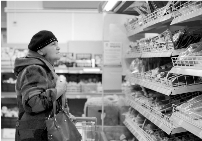
Социально значимые товары теперь будут хорошо видны на прилавках

циально значимых продовольственных товаров первой необходимости в конце декабря 2018 года составила 3337,1 руб. При этом стоимость набора отдельных видов социально значимых продовольственных товаров, реализуемых на ярмарках выходного дня «Хлебосольный выходной» в Орле, на 13,6 % меньше, чем в магазинах области.