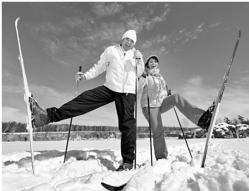
За здоровьем — на лыжах