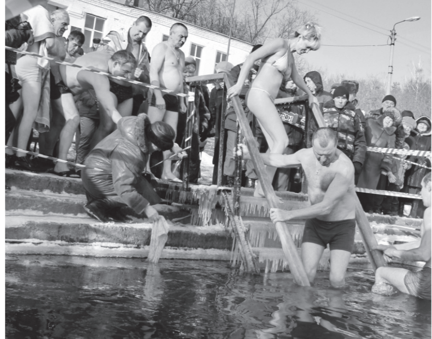
В крещенскую студеною воду не побоялись окунуться даже девушки