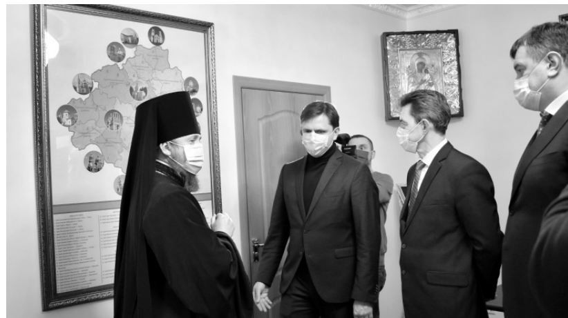
В духовно-просветительском центре Ливенской епархии

— Поликлиника будет включать педиатрическое, консультативно-диагностическое отделения, отделение реабилитации и восста-