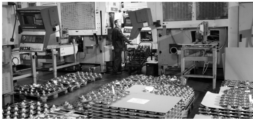
ООО «Арья Фордж» поставляет продукцию для промышленных предприятий России и Республики Беларусь

проведения концертов, лекций, выставок и мастер-классов. Просторные помещения центра позволяют сотрудникам Ливен-