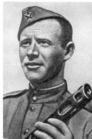
В. И. Образцов