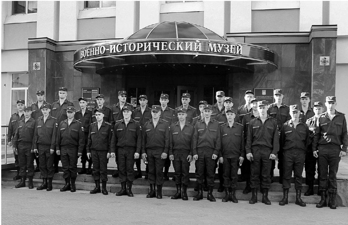
Молодые орловцы охотно идут служить в армию