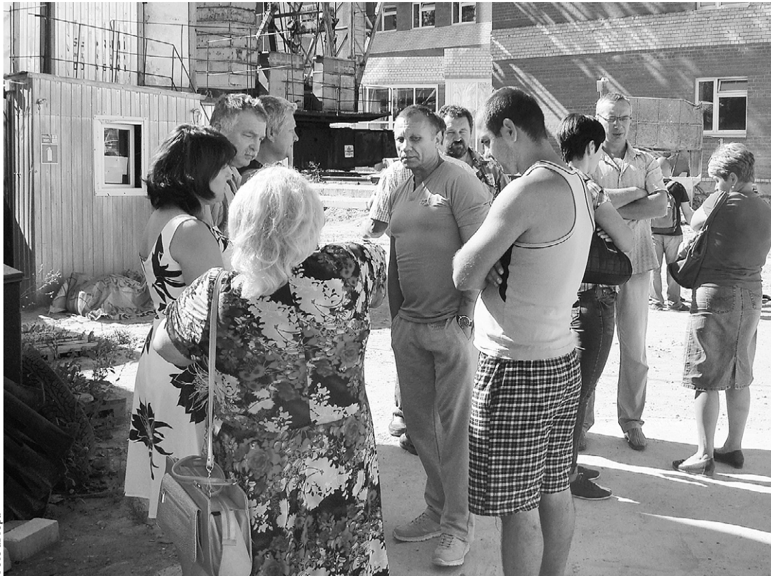
На работу они ходят за новостями о зарплате