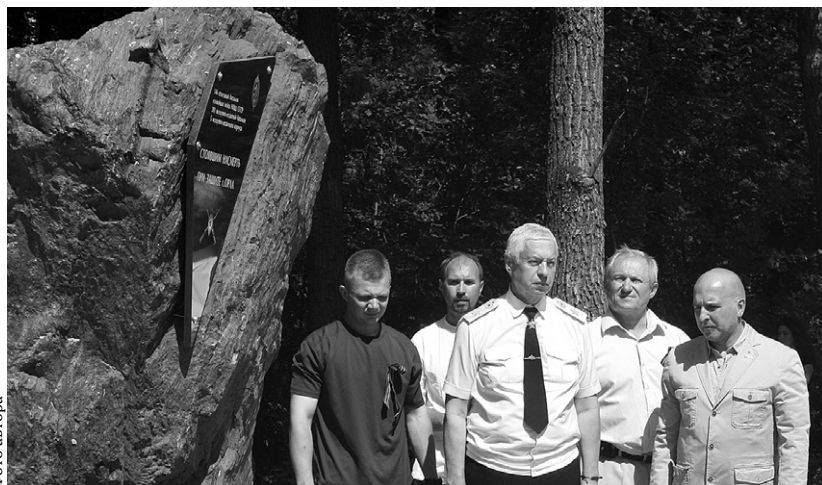
Мемориал павшим защитникам Отечества