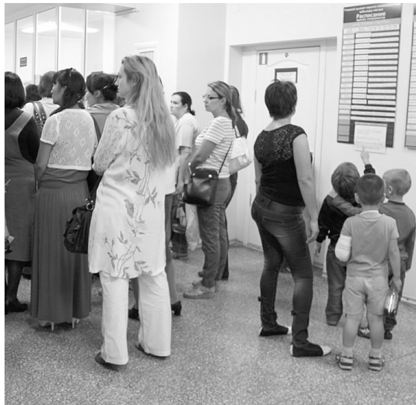
В поликлинике подростку не помогли

Мама с сыном помчались туда. В больнице почему-то удивились появлению подростка, которому понадобилась помощь, как будто люди обратились не в детское медучреждение. Маме сказали,