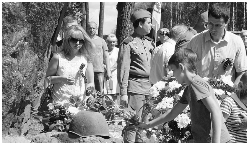
Живые цветы — погибшим под Орлом красноармейцам и расстрелянным мирным жителям