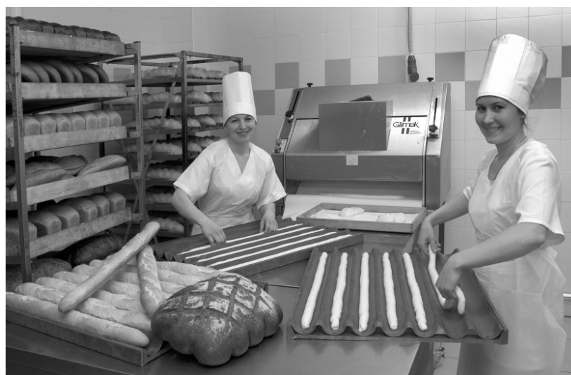
На малый бизнес — большие надежды

Если человек, решивший открыть свой бизнес, не определился с родом