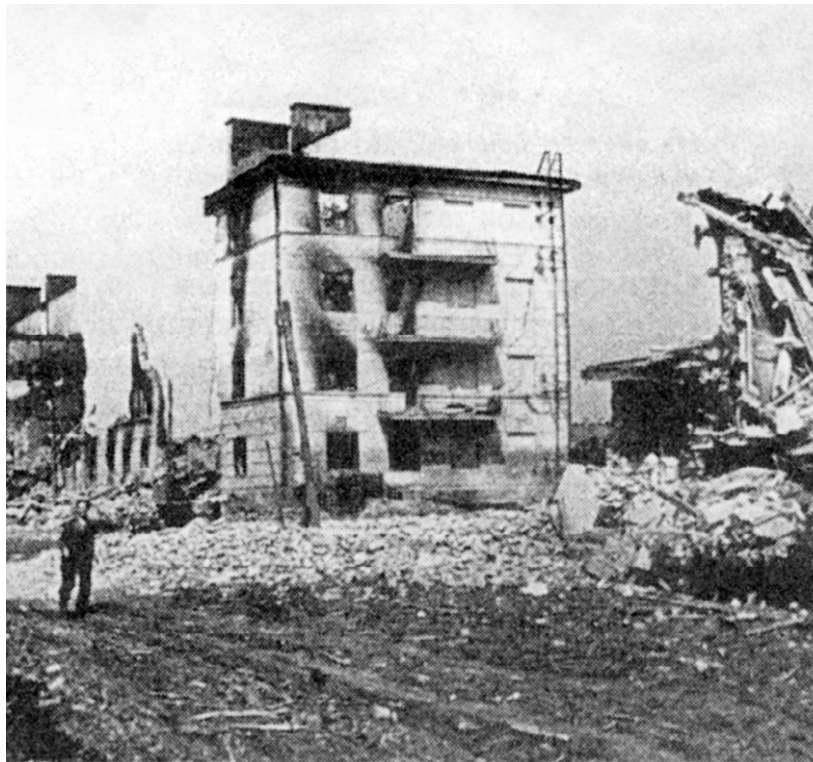
Вид разрушенной ул. Московской. 1943 год

«Августа 15 дня 1943 года. Оперуполномоченным отдела «СМЕРШ» произведён допрос в качестве свидетеля гражданки Л., 1900 года рождения, ранее не судимой, проживающей на улице Нижне-Пятницкая. Вопрос: «Расскажите о событиях, происходивших во время пребывания вражеских войск в городе». Ответ: «Гитлеровцы приказали явиться мужскому и женскому населению на биржу труда. Но жители Пятницкой слободы отказались подчиниться приказу и решили скрываться в каменоломнях в течение двух недель. Примерно дня за два или три немецкими властями Орёл был объявлен боевой зоной. Был уже август. К пещерам на мотоциклах приехало несколько человек жандармов с переводчиком. Он предложил нам выйти, но мы не подчинились. Тогда они начали взрывать. Взрывали несколько раз, но пещеры взрывам не поддались,