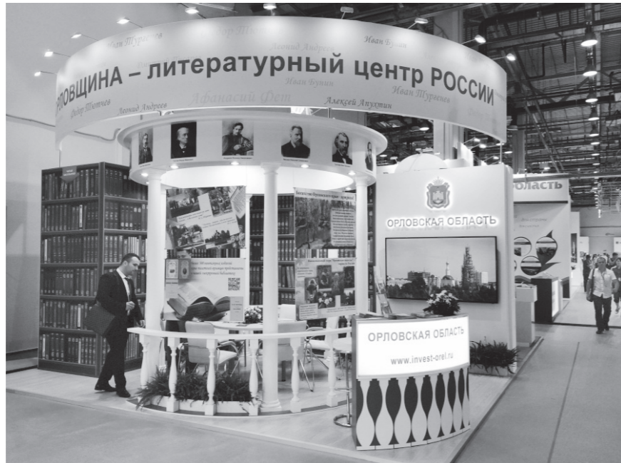
«Визитная карточка» Орловщины