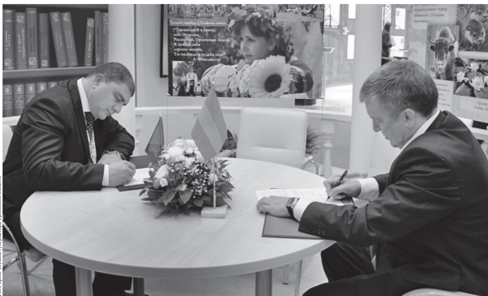
Вадим Потомский и Александр Худилайнен подписали соглашение о сотрудничестве Орловщины и Карелии

Также Вадим Потомский провёл переговоры по вопросам развития межрегионального сотрудничества с губернатором Московской области Андреем Воробьёвым и главой Республики Крым Сергеем Аксёновым.