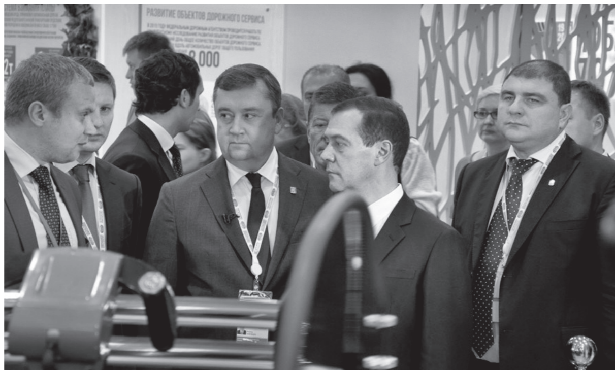
Председатель Правительства РФ Дмитрий Медведев ознакомился с экспозициями регионов

Вадим Потомский отметил, что усиление взаимодействия регионов в современной обстановке необходимо для эффективного