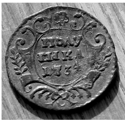
Полушка XVIII века

Теперь найденные останки отправятся в лабораторию антропологов, где учёные определят их пол, возраст и другие характеристики. Выяснят и причину смерти — был