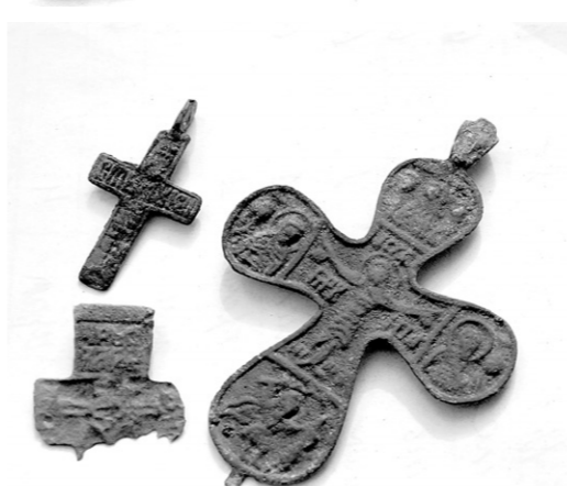
Нательные кресты XVI — XVII веков

ли это мор, война или обычное захоронение в пределах церкви.