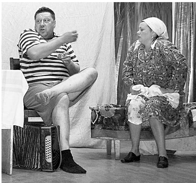
"БЕНЕФИСУ" — 15 ЛЕТ