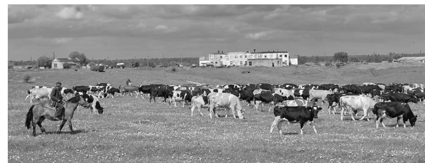
Животноводство — важная отрасль Хотынецкого района

Что касается сельского хозяйства, то сейчас на территории Меловского сельского поселения ООО «Орловский лидер» планируется строительство овощехранилища на 60 тысяч тонн стоимостью 714 миллионов рублей. В этом году филиалом № 4 ООО «Орловский лидер» завершена реконструкция животноводческого комплекса на 360 коров, а к 2016 году планируется построить еще один, на 700 голов. Крупнейший инвестор ЗАО «Орелсельпром» вложил более 200 миллионов рублей в приобретение современной техники и внедрение новых технологий в растениеводство. Особо хочется отметить ООО «Текино», построившее овцеферму на тысячу голов и свиноводческую ферму на полторы тысячи, а также картофелехранилище вместимостью две тысячи тонн, что позволило создать