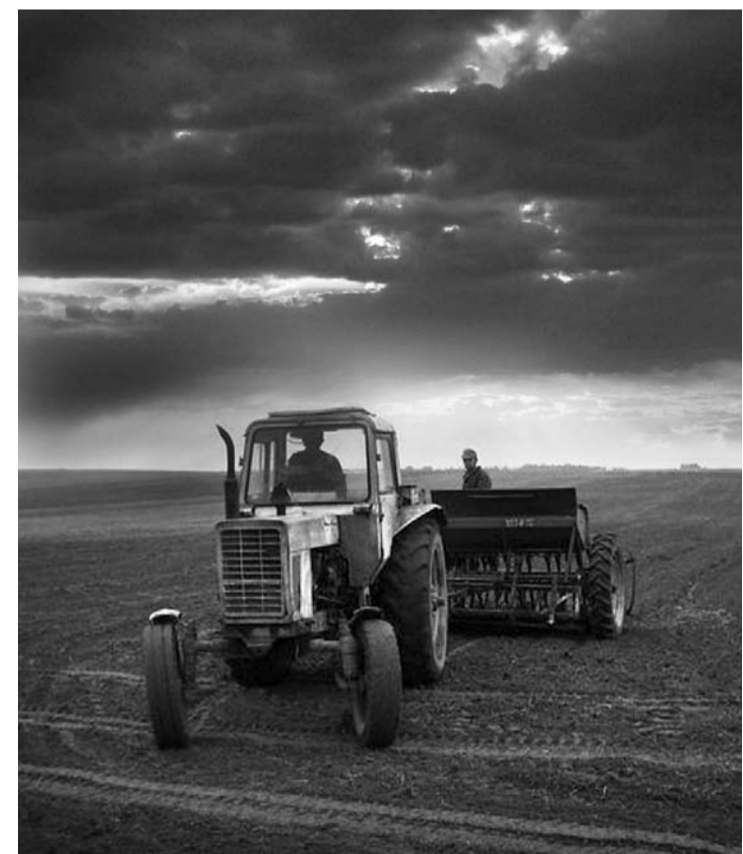
Коллаж Сергея МИРОНОВА

Тревогу вызывает и состояние озимых посевов. Точные сведения о результатах переимовки имеются на сегодня лишь во все той же агрофирме "Мценская", остальные только приступают к проверке озимых. Анализ показывает, что на отдельных участках гибель посевов составляет 25