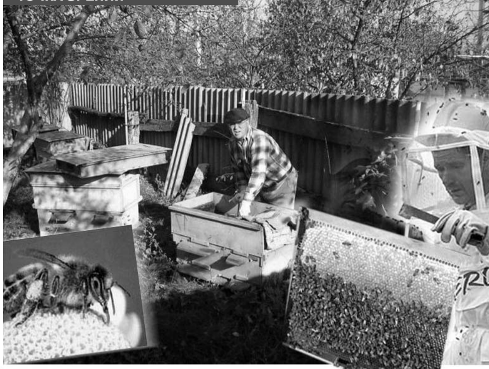
Коллаж Сергея МИРОНОВА

очередь нуждается в поддержке, ему нужна конкретная помощь в обеспечении надежного рынка сбыта пчеловодной продукции, особенно меда.