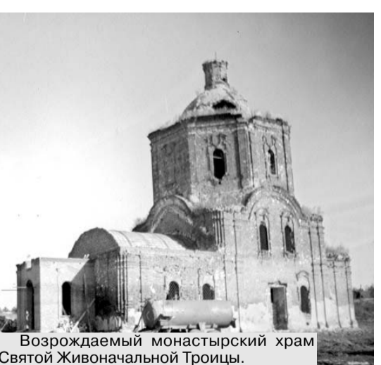
Возрождаемый монастырский храм Святой Живоначальной Троицы.

Старожилы села Задущное рассказывают, что еще в 1936 году храмы и все хозяйственные постройки Троицкого Свято-Духова монастыря были целы. Потом их начали громить, рушить. Было, к сожалению, такое время. Время погружения во тьму безбожия. В результате на месте монастыря чудом уцелели лишь храм в честь Святой Живоначальной Троицы и средняя часть другой церкви. От