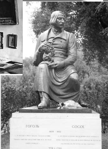
Памятник Н.В. Гоголю. Италия. Рим.

тал режиссер Владимир Бортко (известный удачными экранизациями повести Булгакова «Собачье сердце», романа Достоевского «Идиот» и неудачной экранизацией романа «Мастер и Маргарита»). В главных ролях в картине заняты украинский актер Богдан Ступка, а также Игорь Петренко, Владимир Вдовиченков, Михаил Боярский. Фильм снимался по заказу телеканала «Россия». Это один из самых дорогих фильмов последних лет — его бюджет составил около 20 миллионов долларов. Съемки проходили в Санкт-Петербурге, Киеве, Варшаве, а также на острове Хортица, на фоне историко-культурного комплекса «Запорожская Сечь». Замысел режиссера — напомнить двум славянским народам об их общей истории.