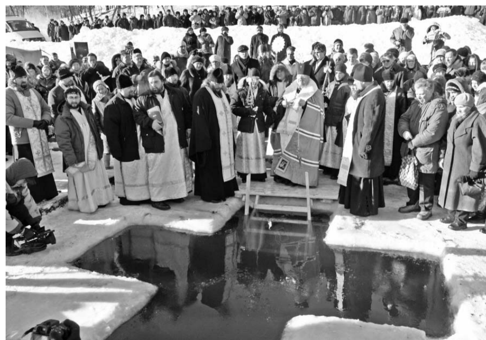
Для чего во льду делали прорубь в форме креста — иордань (от названия реки Иордан), — вокруг которой совершался крестный ход, а вода освящалась. Крестный ход «на Иордань» совершался во всех больших и малых селениях. Смелчаки окунались в ледяную воду три раза с головой. Сегодня вновь возрождаются

ский сочельник и в день праздника. Это делается в память о том, как Иисус своим собственным крещением освятил воды Иордана. Освящение в оба дня происходит одинаковым чином, поэтому вода, освященная в эти дни, ничем не отличается. Считается, что после этого вода обретает особую чудодейственную силу. Она обладает удивительными свойствами — прежде всего духовными, укрепляющими и просветляющими человека. К храмам тянутся длинные очереди за крещенской водой. Особым свойством крещенской воды является то, что, добавленная даже в небольшом количестве к воде обычной, она передает благодатные свойства и ей. Нельзя забывать, что освященная вода — это церковная святая, с которой соприкоснулась благодать Божия и которая требует к себе благоговейного отношения. На Руси Крещение истари праздновалось широко и торжественно. Было принято освящать воду в реке или озере,