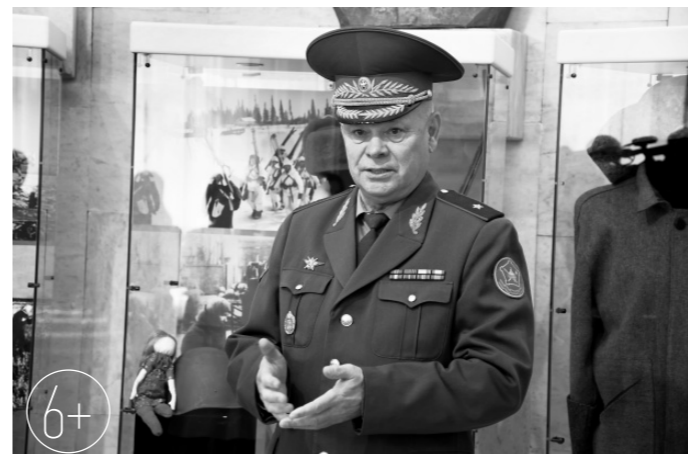
Владимир Козлов — Залог победы — в единстве фронта и тыла

наши бойцы проявляют массовый героизм, сражаются не на жизнь, а на смерть, — подчеркнул он. — Это сильные, мужественные люди, которые обязательно победят. Россия будет жить вечно!