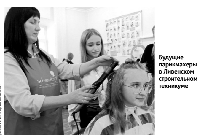
Будущие парикмахеры в Ливенском строительном техникуме

Профессиональная проба в качестве медицинской сестры мне очень понравилась. Нам рассказали о профессии медсестры в целом, сестринском деле и о профессии фельдшера и акушера. Мы узнали о плюсах, минусах и ответственности работы в поликлинике, научились делать сердечно-лёгочную ре-