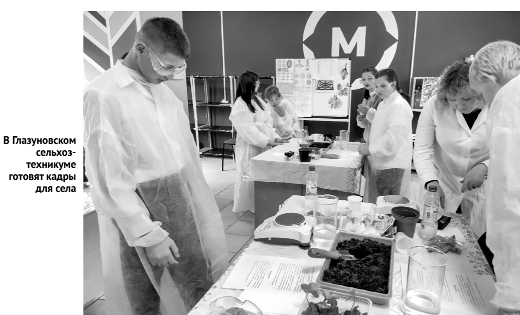
В Глазуновском сельхозтехникуме готовят кадры для села

В Орловской области стартовали профессиональные пробы федерального профориентационного проекта «Билет в будущее», который реализуется в рамках нацпроекта «Образование». По итогам первой недели участниками профпроб стали 204 школьника. Всего же попробовать себя в разных профессиях смогут около 800 учащихся школ региона. Профессиональные пробы проходят на площадках колледжей и техникумов, а также Среднерусского института управления — филиала РАНХиГС и Дворца пионеров и школьников им. Ю. А. Гагарина.