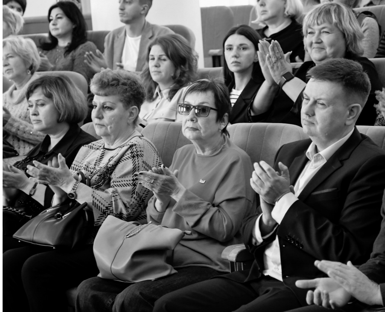
Орловские дорожники принимают поздравления