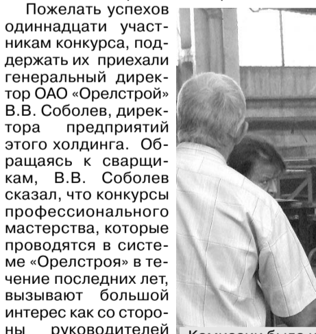
Комиссии было непросто определить лучших.

(Окончание. Начало на 1-й стр.) В цехе были установлены только что изготовленные металлические емкости (многие, наверное, видели, как на стройках высоченные краны переносят раствор в подобной «таре»). Каждому участнику конкурса нужно было за полтора часа проварить все швы в своей емкости. Удоль стены рядом со входом в цех были установлены столы, за которыми потом предстояло вести жаркие споры при подведении итогов членам комиссии и где сварщики тянули билеты с вопросами по теории. На стене висел плакат «Привет участникам конкурса!» Звучала музыка, добавлявшая хорошего настроения.