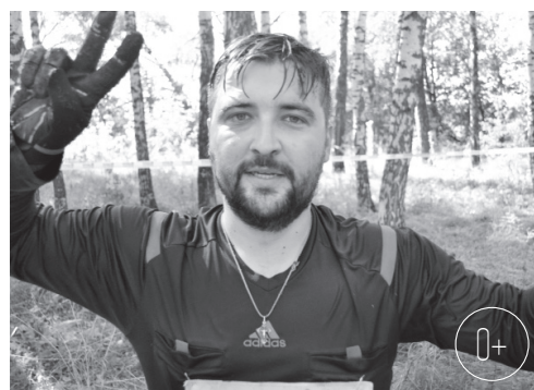
«Тропа героев» — это круто!