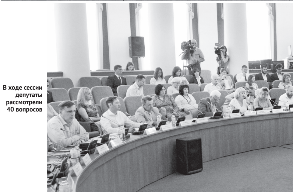
В ходе сессии депутаты рассмотрели 40 вопросов

вручаться за выдающиеся заслуги в социально-экономическом, научно-техническом развитии региона, государственном и муниципальном управлении, развитии парламентаризма, защите прав и свобод человека, развитии местного самоуправления, укреплении законности и правопорядка при исполнении служебных обязанностей, а также за выдающиеся достижения в сфере образования, здравоохранения, культуры, спорта, общественной, благотворительной и иной деятельности.