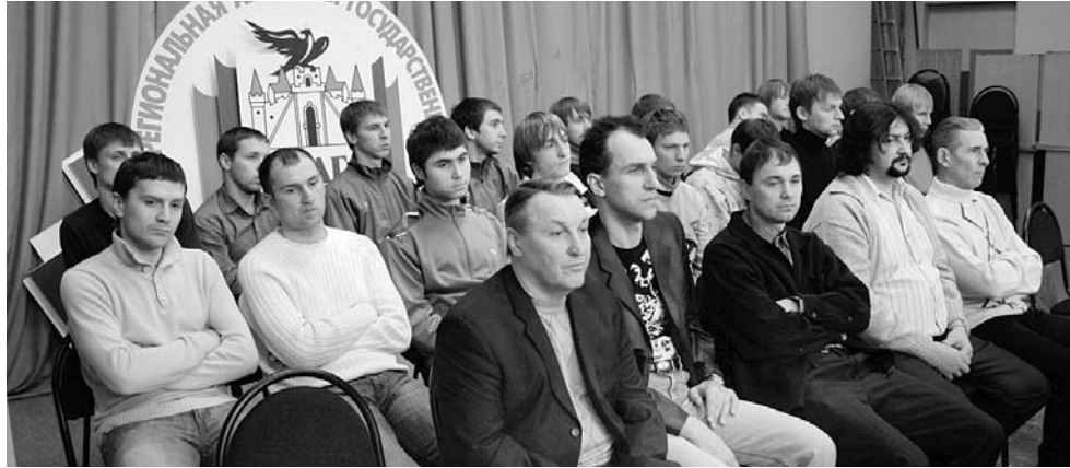
Команда ПФК «Русичи».