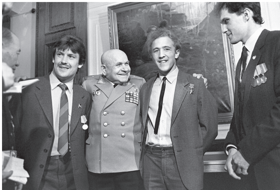
После церемонии вручения медалей «Воину-интернационалисту от благодарного афганского народа»