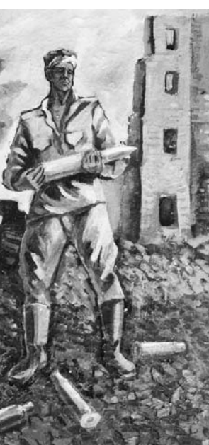
Картина Г.А. Пищалова.