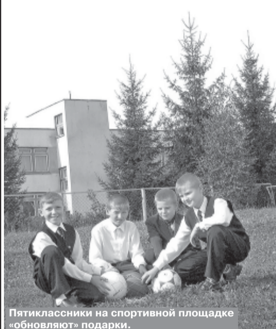
Пятиклассники на спортивной площадке «обновляют» подарки.