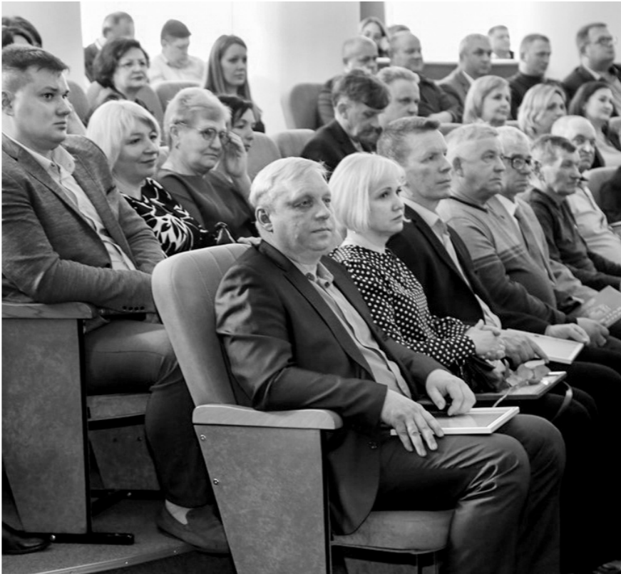
Лучшие работники отрасли получили заслуженные награды