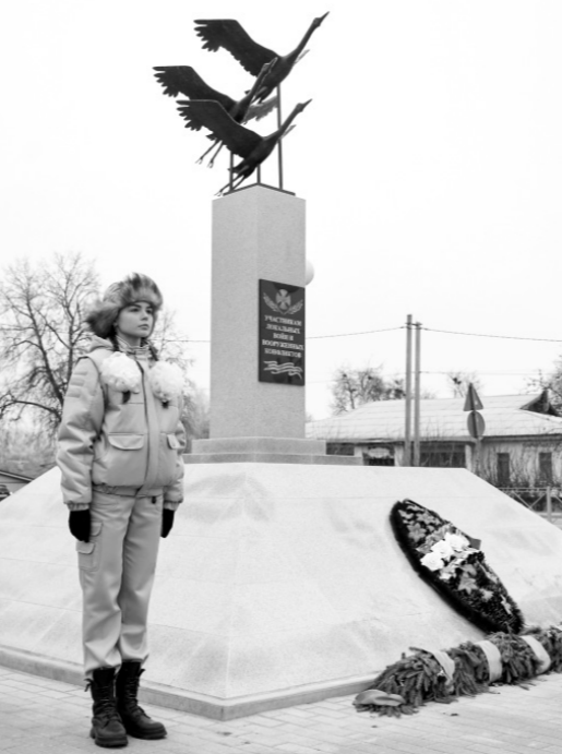
Памятный знак в честь участников локальных войн и вооружённых конфликтов