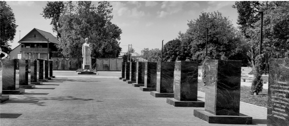
Мемориал «Скорбящая мать» — место скорби и гордости