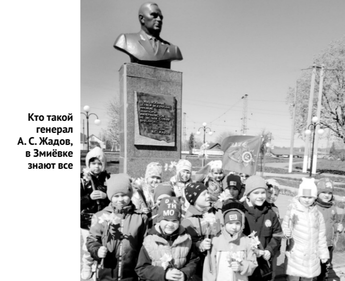
Кто такой генерал А. С. Жадов, в Змиёвке знают все

лисы под откос военные эшелоны с живой силой врага, техники, боеприпасами. Оккупация района продолжалась 20 месяцев. Захватчики пытались устроить население карательными мерами. За период оккупации Свердловского района фашистские палачи расстреляли 73 человека, семерых повесили, двух сожгли живьём, троих замучили и казнили, насильственно угнали в Германию 526 человек.