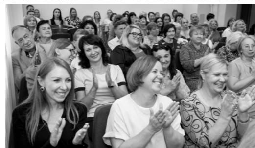
Эпидемиологи — представители трудной, но исключительно важной профессии

— Мы сегодня чествуем истинных профессионалов, истинных патриотов Отечества, которые, несмотря на все сложности, добросовестно выполняют свою работу, — сказал глава региона. — Вы 24 часа в сутки и семь дней в неделю остаётесь на страже здоровья орловцев. Ситуация во время эпидемии коронавируса это наглядно подтвердила. Мы увидели ваши лучшие не только профессиональные, но и личные качества. Здоровья вам и с праздником!