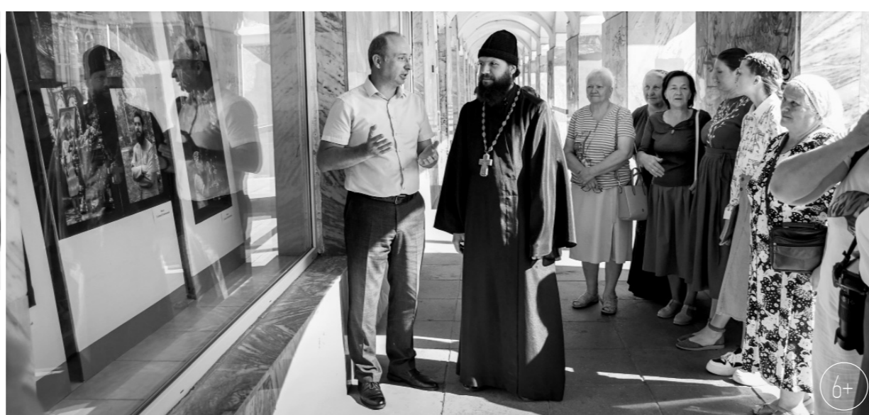
На открытие выставки пришли прихожане храма-юбилея