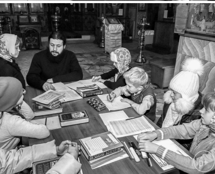
Занятие в воскресной школе