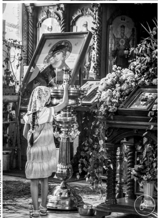
Троицын день в храме