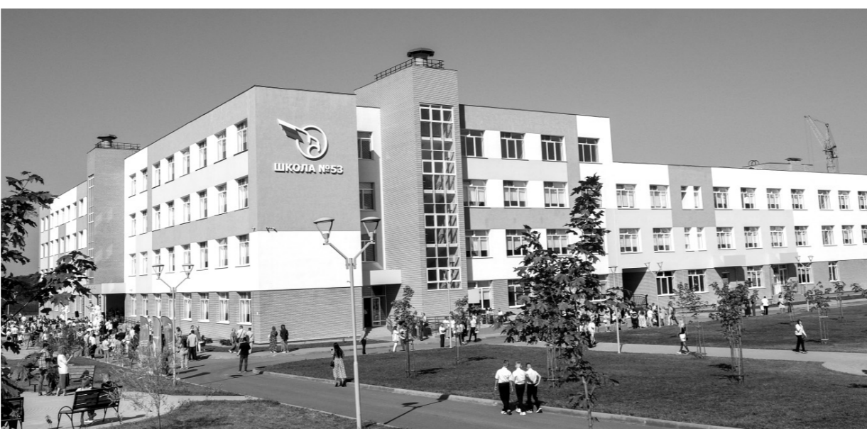
2 сентября в гостонаселённом районе Орла была торжественно открыта школа №53 на улице Зеленина, построенная в рамках нацпроекта «Образование»

Юрий Ревин подчеркнул, что реализация национальных проектов на территории Орловской области находится на особом контроле депутатского корпуса и что необходимо жёстко соблю-