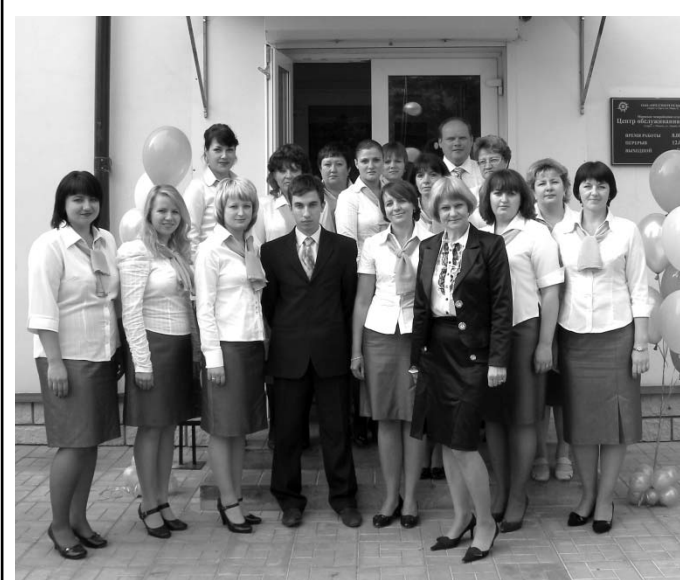
Молодой коллектив Мценского ЦОКа всегда рад своим клиентам.

В минувший понедельник, 6 сентября, прошла первая клиентская лотерея Открытого акционерного общества «Орловская сбытовая компания».