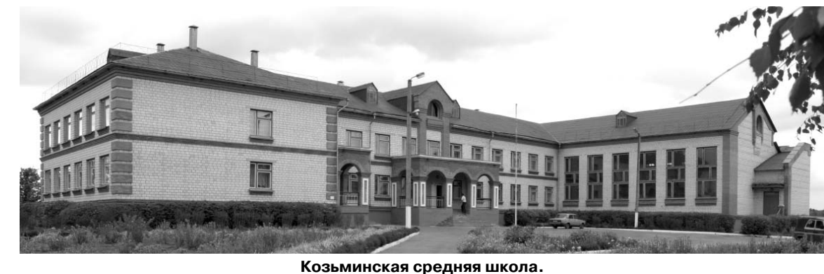
Козьминская средняя школа.

Наталья ЗАРУБИНА, Ливенский район.