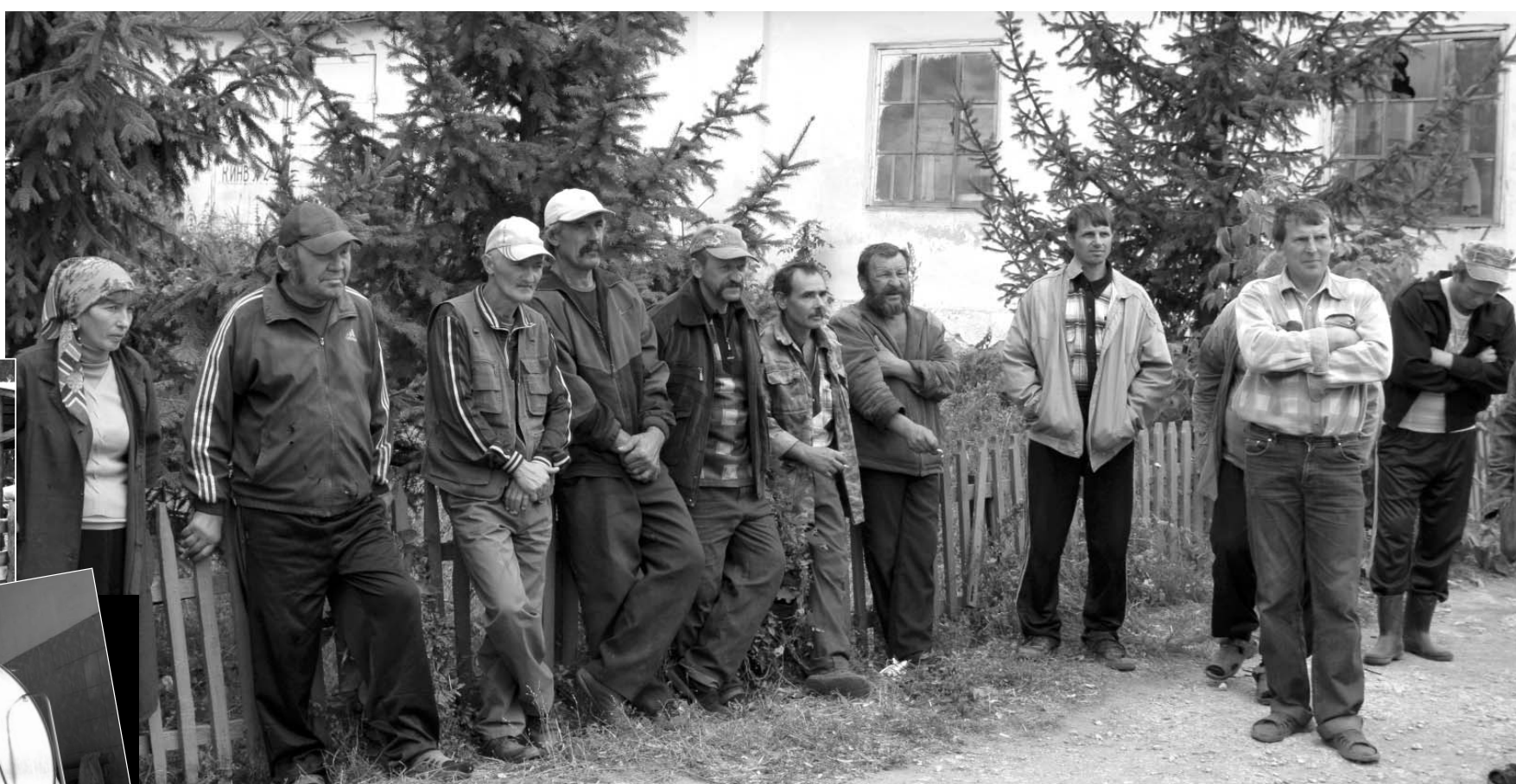
Коллектив ЗАО «Козьминское».

(Окончание. Начало на 1-й стр.) На днях мы побывали в подразделении агрофирмы ЗАО «Козьминское», где более 90 человек: механизаторы, водители, работники токового хозяйства, не будучи уволенными, уже фактически остались без работы. Трудоспособный и дружный коллектив предприятия, а большинство людей проработали здесь помногу лет, вдруг оказался не у дел: из 1500 гектаров, запланированных под озимый сев, две трети не обрабатываются, в поле осталась гречиха, по словам работников хозяйства, из-за того, что убирать стало просто нечем — технику из «Козьминского» забрали; бурьяном заросло 900 гектаров паров. Из хозяйства вывезено практически все зерно урожая 2010 года, при этом с людьми не рассчитались за период уборки.