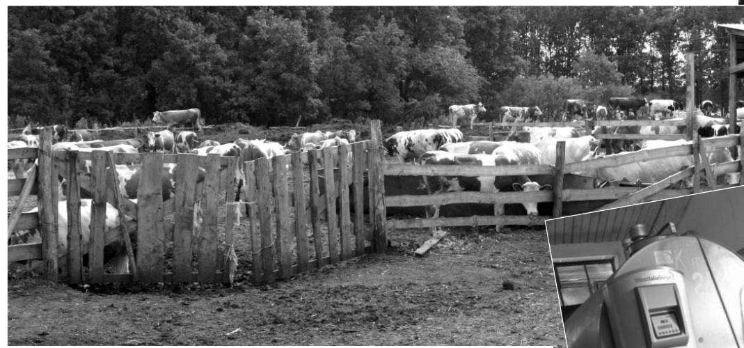
Тёлки на выгулочной площадке буквально утопают в навозе.