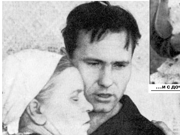
Шукшин с матерью...

В 1945—1947 годах Шукшин учился в Бийском автотехникуме, затем работал слесарем-такелажником и разнорабочим на заводах Калуги и Владимира, потом служил на флоте. В 1953—1954 годах Василий Шукшин был учителем истории и директором школы сельской мо-