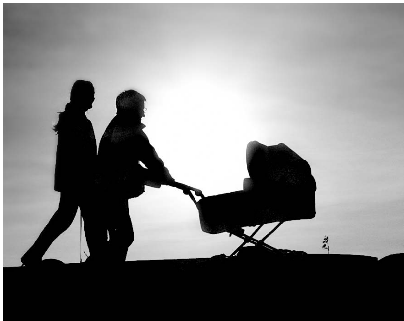
Фото К. Сотникова, г. Орел.

Наш адрес: 302000, г. Орел, ул. Брестская, 6, к. 33.