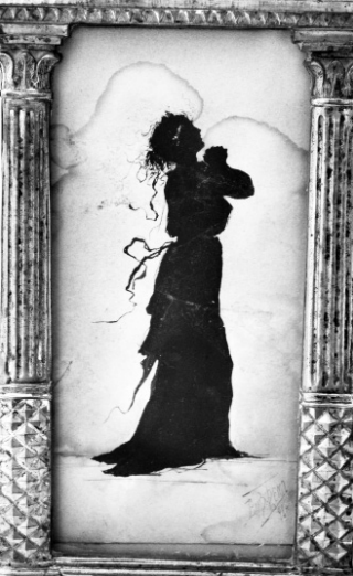
Силуэт Елизаветы Бём к произведению Николая Лескова «Оскорбленная Нетэта»

Конечно, Е. М. Бём подарила писателю этот силуэт. Его и сейчас можно увидеть в экспозиции музея — в зале, где представлены вещи из петербургского кабинета писателя. «Историю и свойства камне- в произведениях Н. С. Лескова» представила старший научный сотрудник Дома-му-