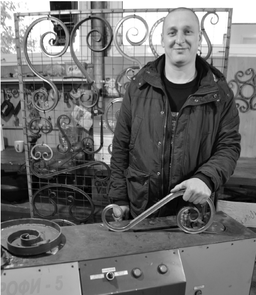
Александр планирует наладить изготовление изделий художественнойковки

Выделенных денег в размере 250 тысяч рублей Венедиктову хватило на то, чтобы приобрести на одном из российских заводов новый современный станок для