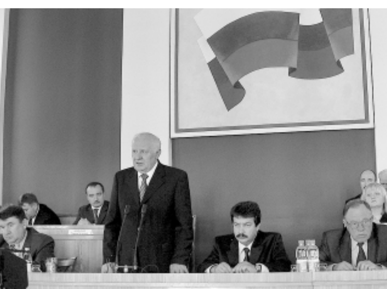
Сегодня имеют заработную плату 9 — 12 тысяч. Надо подтягиваться и остальным.

Следующий вопрос — это социальные обязательства. Думаю, время, когда промышленные предприятия сбрасывали с себя всю социальную сферу, ушло навсегда.