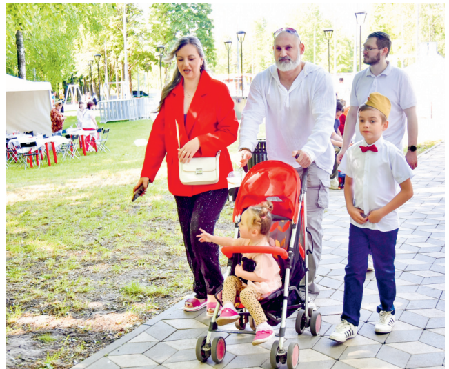
Каждая из тематических зон кульТПикника была уникальна и интересна