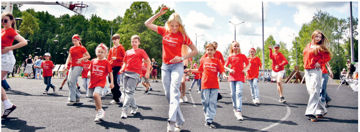
Счастливое и беззаботное детство!