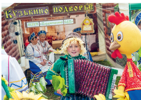
Без устали развлекал гостей юный гармонист

многих людей — работников органов местного самоуправления, депутатов, руководителей хозяйствующих субъектов, общественников!