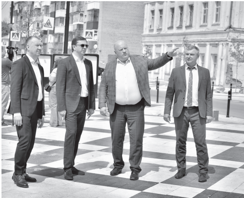
Ко Дню города Мценска завершится благоустройство центральной улицы по проекту «Мценская верста»

В ходе посещения Комплексного центра социального обслуживания населения города Мценска губернатору презентовали новую практику кратковременного присмотра и ухода за детьми до трёх лет, которая называется «Социальная няня». Это новая форма поддержки для семей, при которой квалифицированные специалисты временно заботятся о ребёнке как в учреждениях социального обслуживания, так и на дому. Услуга рассчитана на семьи, которым