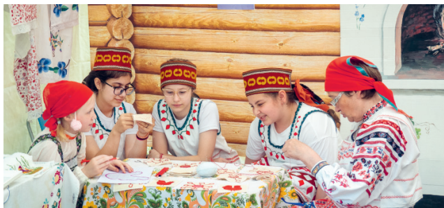
Отличное настроение было у всех — у взрослых и детей

Наши достижения — не случайность! Они стали возможны только благодаря совместной, кропотливой, подчас очень сложной работе