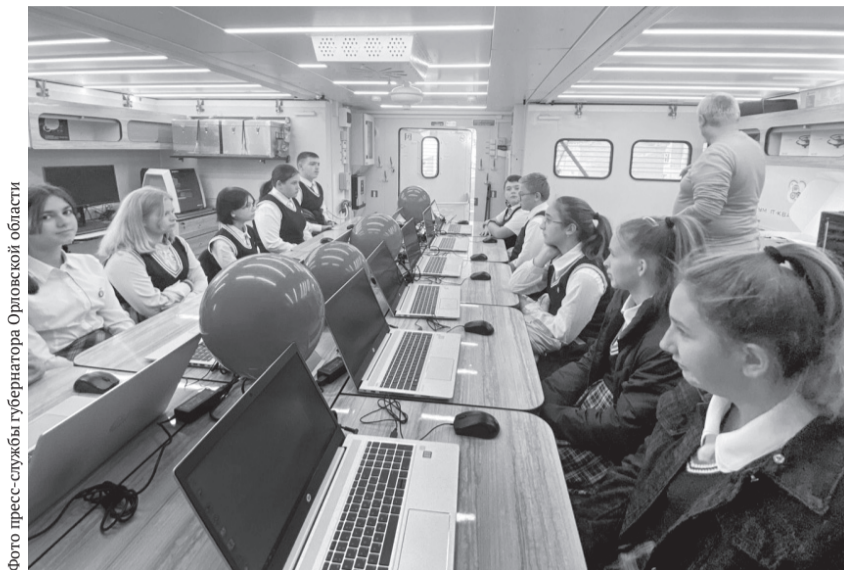
На занятиях по робототехнике и информационным технологиям

Так, в новом корпусе технопарка «Кванториум» на ул. Горького в Орле площадью более 2 тысяч кв. метров ежегодно обучаются свыше 800 детей в возрасте от 7 до 18 лет.