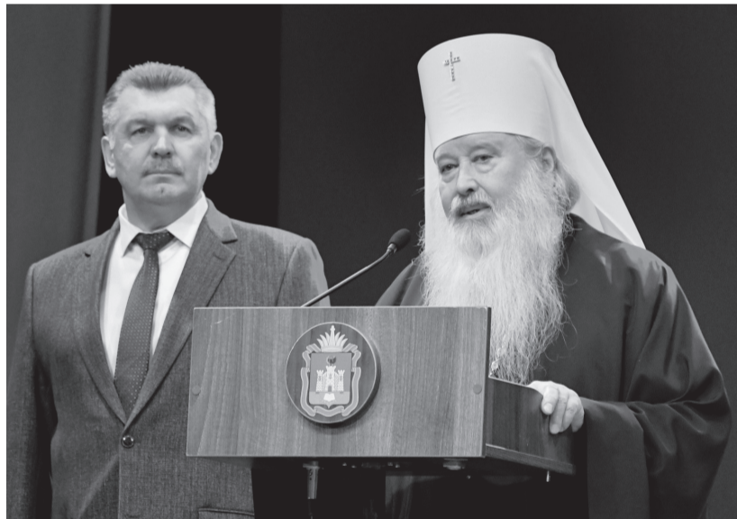
С тёплыми словами к участникам торжества обратились заместитель губернатора Орловской области по социальной политике Олег Ревякин и митрополит Орловский и Болховский Тихон

— Символично, что мы встречаемся в День Конституции Российской Федерации, — сказал Олег Ревякин. — Основной закон — один из