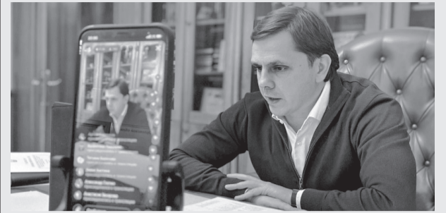
Главное из прямого эфира в социальных сетях губернатора Орловской области Андрея Клычкова за минувшую неделю.