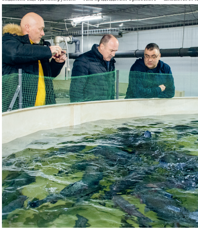
Около 2000 тонн рыбы в год производится на Змиёвском рыбобродном комплексе

ществляются выплата заработной платы и отчисления во внебюджетные фонды, производятся расчёты с поставщиками за оказанные услуги и авансовые платежи за потребляемые энергоресурсы. В целях оказания финансовой помощи бюджетам сельских поселений районным бюджетом в 2024 году было выделено 4,7 млн. рублей на исполнение действующих расходных обязательств. До конца года в целях недопущения просроченной кредиторской задолженности по заработной плате будет выделено ещё 1,2 млн. рублей.