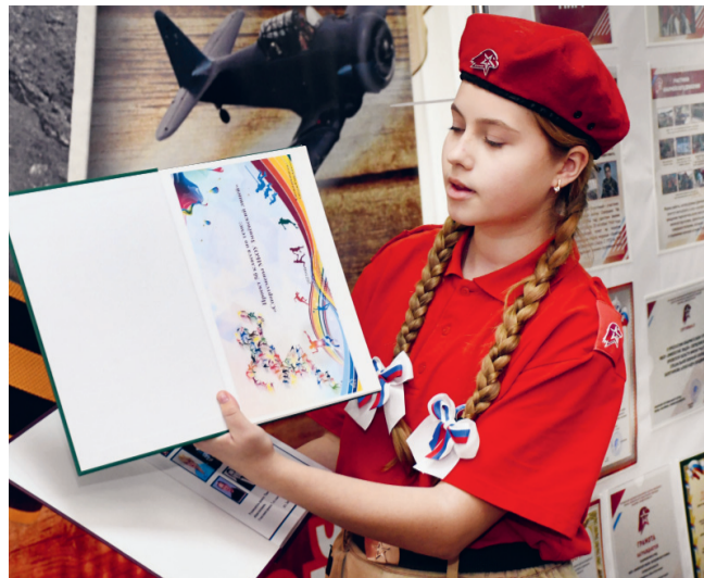
В музее «Наши истоки» Змиёвского лица