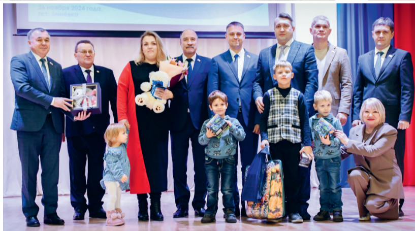
Награды облсовета — заслуженным людям района и многодетным семьям

— Свердловский район в последние годы показывает