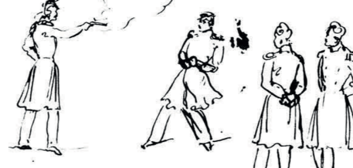
Дуэль. Рисунок Лермонтова

В интернетской «Википедии» сказано, что дальним родственником лермонтовского секунданта является артист Пётр Глебов — знаменитый Григорий Мелехов из фильма «Тихий Дон».