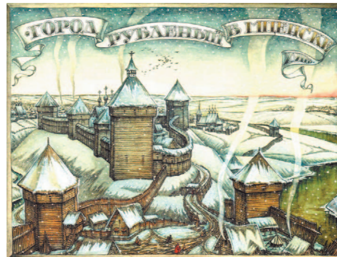
Иллюстрация из книги «Древние города земли Орловской»

— Не обижусь. Как историк я доверяю только фак-