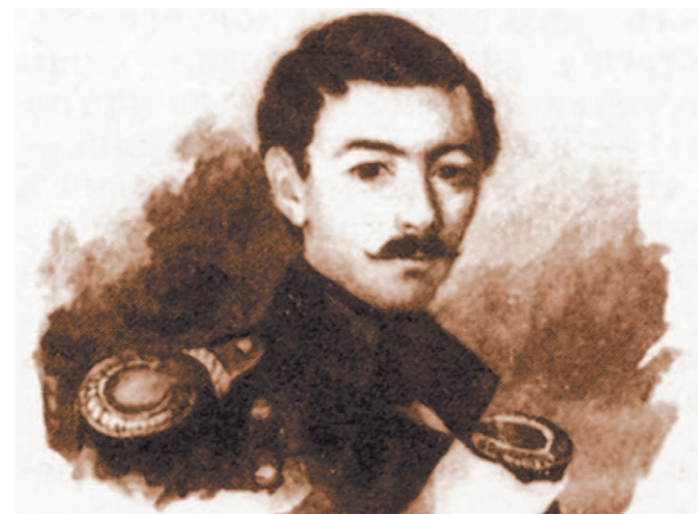
М.П. Глебов. Акварель неизвестного художника

13 (27) июля в доме Верзилиных был бал, на котором