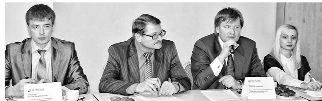
Представители Сбербанка ответили на многочисленные вопросы сельхозтоваропроизводителей области

— Мы представляем кредит «БИЗНЕС-ДОВЕРИЕ», «БИЗНЕС-ОБОРОТ», «БИЗНЕС-ИНВЕСТ», «БИЗНЕС-АКТИВ», «БИЗНЕС-АВТО» и «БИЗНЕС-НЕДВИЖИМОСТЬ», — пояснила начальник сектора организации продаж отдела продаж малому бизнесу Орловско-