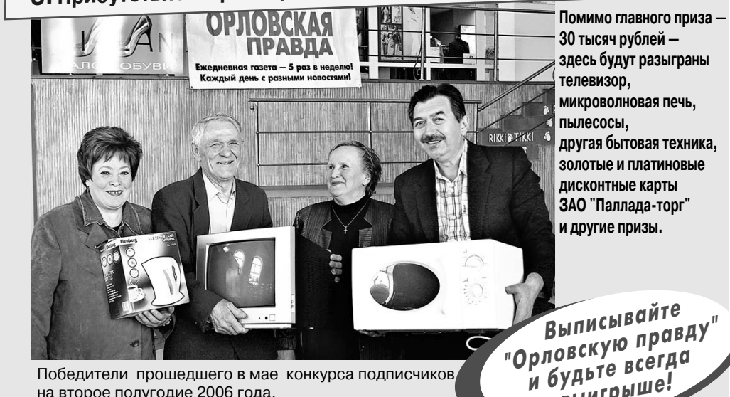
Победители прошедшего в мае конкурса подписчиков на второе полугодие 2006 года.

3. Присутствие на розыгрыше является обязательным условием.