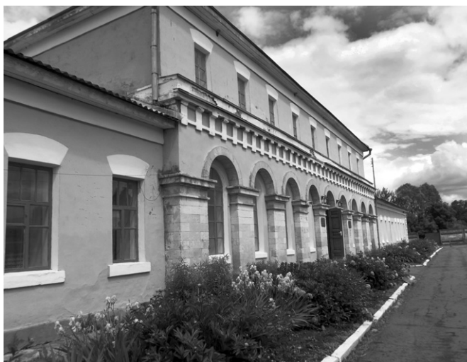
Гостевому дому Шатиловых — более 160 лет