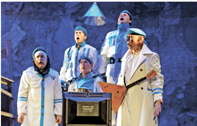
Лучший спектакль большой сцены — «Полковник-птица»

профессиональнее. Зрители не уходили со спектаклей с пустым сердцем — а это главный показатель успеха.