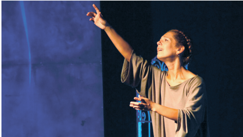
Гран-при фестиваля получил спектакль «Были слёзы – больше глаз»