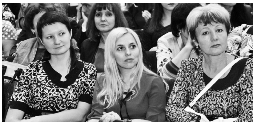
Забота о людях — их профессия