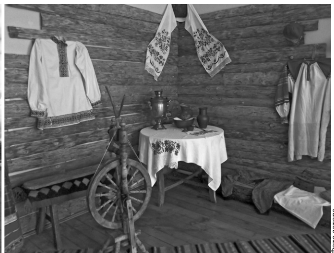
Здесь русский дух!