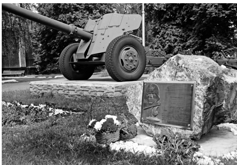
Памятный мемориал Николаю Сиротинину, установленный в сквере завода «Орёлтекмаш»

Текмашевцы вообще гордятся своей историей. Мно-