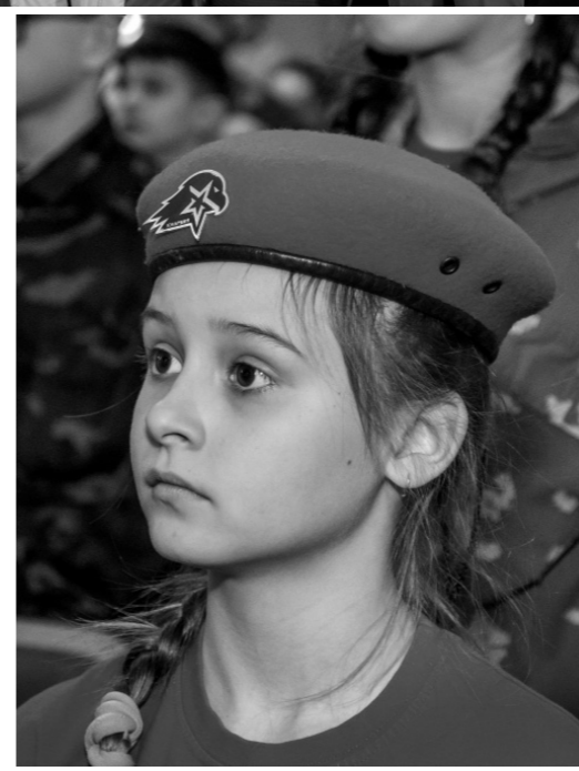
Быть юнармейцем — почётно!