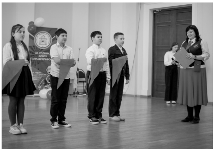
Торжественное посвящение в пионеры

Во Дворце пионеров и школьников имени Ю. А. Гагарина прошёл третий региональный фестиваль детских организаций Орловской области.