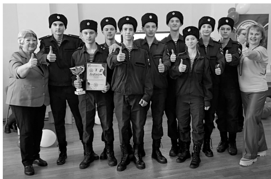
Команда «Казачи — орлята» Черкасской СОШ Кромского района — победители фестиваля детских активистских организаций