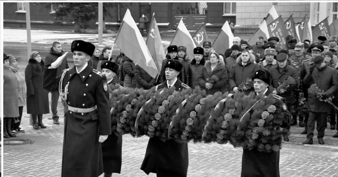
Торжественная церемония у стелы «Орёл — город воинской славы»